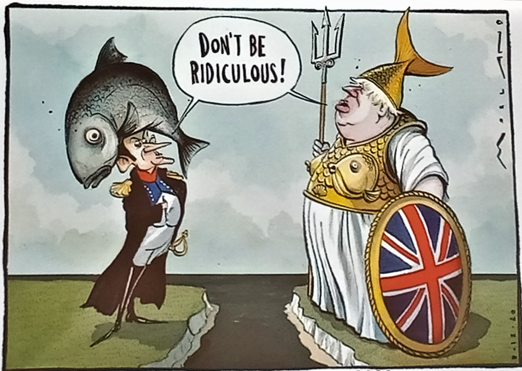
Morten Mroland, The Times , 8 décembre 2020