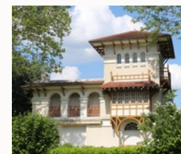
LE VÉSINET (78)

Théophile Bourgeois a profité de l'engouement des classes aisées désireuses de s'éloigner des banlieues surpeuplées et polluées par les nombreuses industries installées près de Paris. Les ballades sur la Seine sont très prisées ainsi que les parties de pêche. Des maisons ont été retrouvées notamment à Poissy, Triel, Andrésey, Meulan, Carrières-sous-Poissy, Les Mureaux, Flins, Plaisir, Épône, Conflans-Sainte-Honorine, Hardricourt, Mézy, etc.