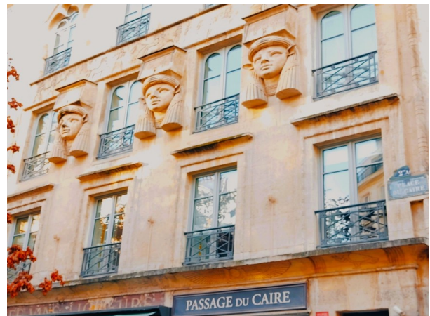
Sortie Passage du Caire l'après-midi